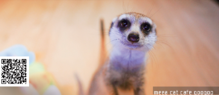
meerkat cafe googoo