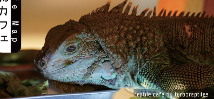
reptile cafe by turboreptiles