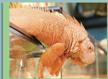
reptile cafe by turboreptiles