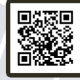
cafe mignon ウサギカフェ (Rabbit Cafe)