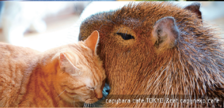
capybara cafe TOKYO & cat capyneko cafe