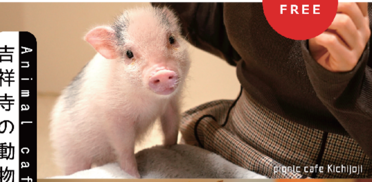
pignic cafe Kichijoji