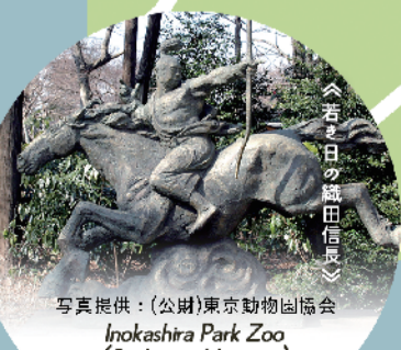
Inokashira Park Zoo (Sculpture Museum)