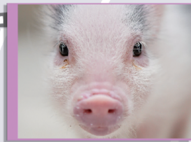
pignic cafe kichijoji