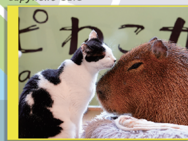
capybara cafe TOKYO & cat capyneko cafe