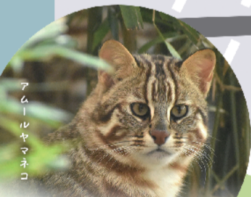
写真提供：(公財)東京動物園協会 Inokashira Park Zoo