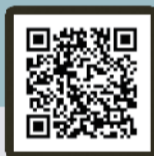
Cat Cafe Temari no Oshiro 猫カフェ (Cat Cafe)