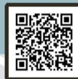
Cat Cafe Temari no Ouchi 猫カフェ (Cat Cafe)