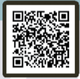
Dog Cafe Rio Kichijoji 犬カフェ (Dog Cafe)